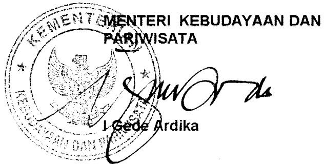
I Gede Ardika

Batas-batas : • Utara : - • Timur : - • Selatan : - • Barat : - Luas bangunan : m 2 Luas tanah : 3.218 m 2 Status Pemilikan : Negara (Pemerintah Daerah Tk. II Banggai)